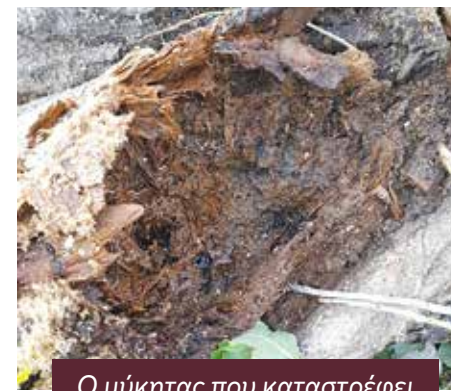
Ο μύκητας που καταστρέφει το εσωτερικό των δέντρων

Σύμφωνα με το ρεπορτάζ, ο Δήμος Ηλιούπολης ετοιμάζει άμεσα μια σχετική φυτοτεχνική μελέτη με την οποία