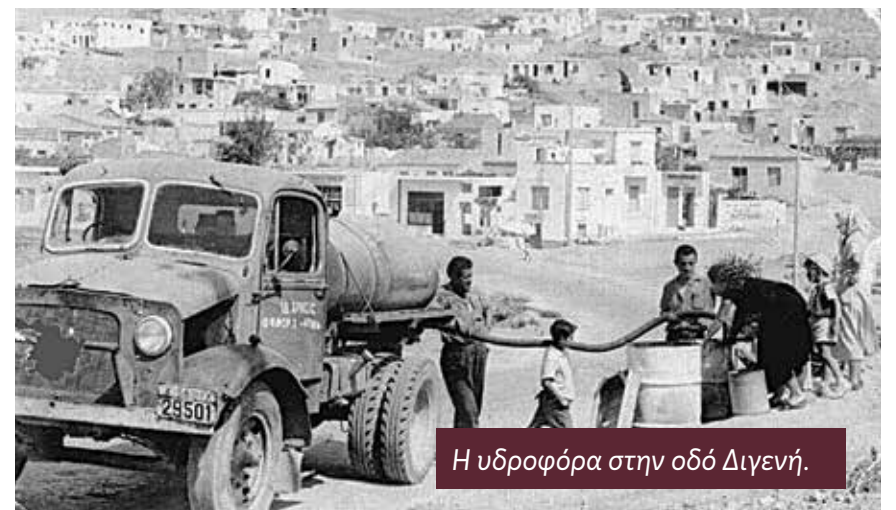
Η υδροφόρα στην οδό Διγενή.