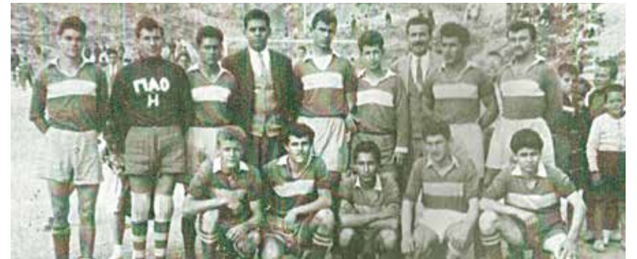
Ο ΠΑΟ Ηλιούπολης, πρόδρομος του σημερινού Γ.Σ Ηλιούπολης.

Η Ομάδα Προφορικής Ιστορίας ιδρύθηκε πριν από δύο χρόνια με σκοπό να διερευνήσει την από τα «κάτω» ιστορία της πόλης μέσω συνεντεύξεων από παλιούς κατοίκους, συγκέντρωση υλικού φωτογραφιών κ.λ.π. Προσκαλεί όποιον συμπολίτη μας θέλει να συμμετάσχει, ή και να μας καταθέσει την προσωπική του μαρτυρία καθώς και φωτογραφίες, παλιές εφημερίδες ή ό,τι άλλο νομίζει ότι θα φανεί χρήσιμο. Οποιοσδήποτε ενδιαφέρεται να συνδράμει με υλικό από την ιστορία της Ηλιούπολης στην ΟΠΙ, μπορεί να επικοινωνήσει μέσω mail στο opi.ilioupolis@gmail.com