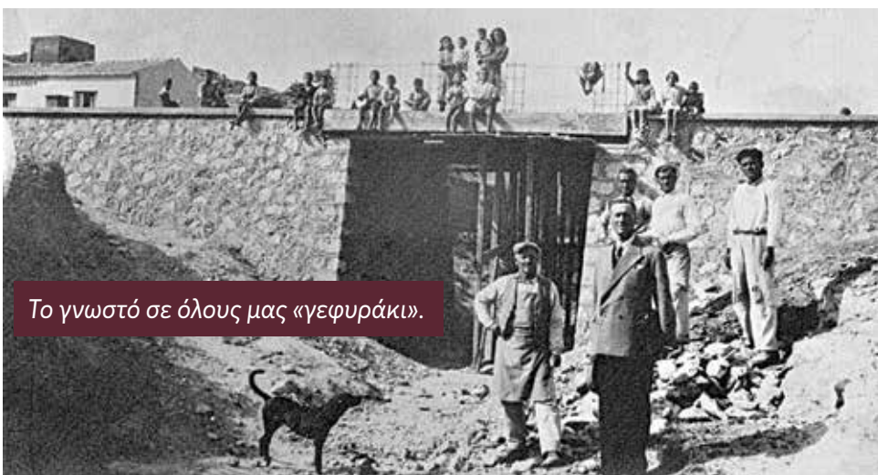
Το γνωστό σε όλους μας «γεφυράκι».