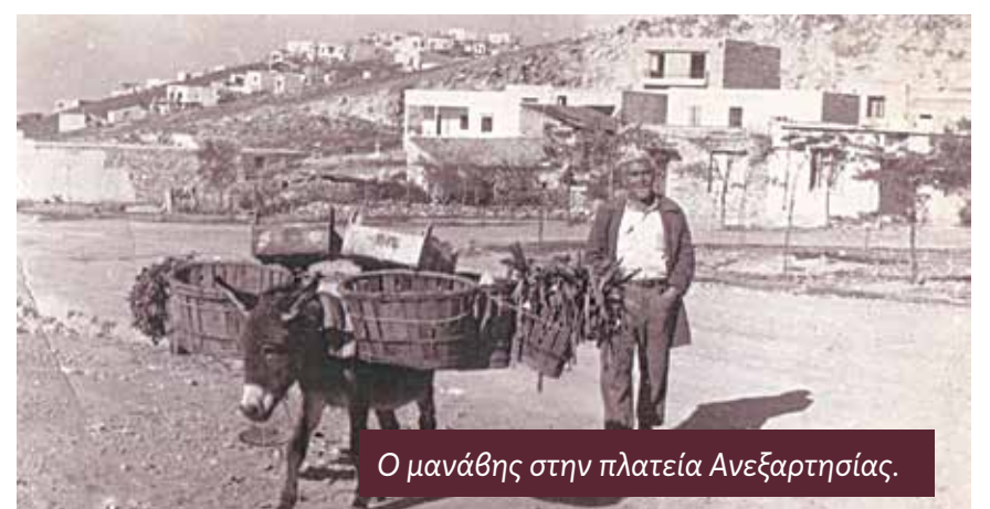
Ο μανάβης στην πλατεία Ανεξαρτησίας.