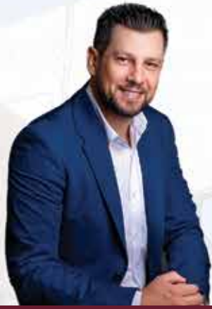
Στάθης Ψυρρόπουλος Δήμαρχος